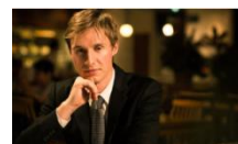
Hommage au Plat pays, de César Franck à Jacques Brel Musique en Forêt

Le jeudi 14 juillet , repas à 12h30 (sur réservation) et activités pour tous à partir de 15h30. Venez nombreux vous divertir !