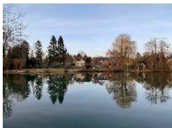
1 er prix

Le vote a été fait par les associations de Rethondes : le Comité des Fêtes, l'ASCLR, le RCR, l'APE, la Bibliothèque et la Paroisse.